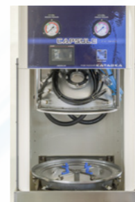
カプセル内回転器具部