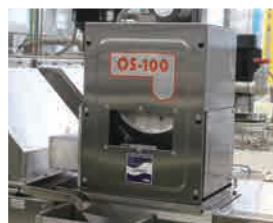
オイルスキマー (標準装備)