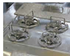
鉄磁濾BMT-900 (オプション)