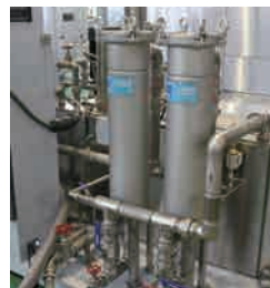
バッグ式フィルター (オプション)