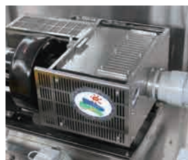
ジョーキゲン SC-400 (標準装備)